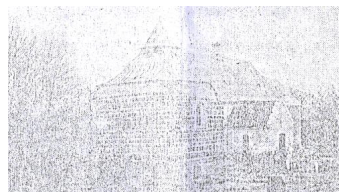
Hallund Kirke som den saa ud indtil 1911

dets fald sattes et lavt puklet, løgformet Spir paa Taarnets Plads. Dog kan det hændes, at det er sket i 1706, i den Sommerstorm, der da hærgede Borg og Hytte, Kirke og Kloster i Nordjylland i meget omfattende Grad. Da Spirets Blyplader 1911 toges ned, bar en af dem to Navnetræk og Aarstallet 1706. Det tyder paa en Ændring i Spirets Form dette Aar. Denne aparte Spirafslutning havde Hallund Kirke indtil 1911, da den - efter at Vaabehuset var ombygget 1910 - fik sin nuværende Skikkelse. Forhen saa den paa Afstand nærmest ud til at være kullet.