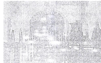
Hallund Kirke indvendig.